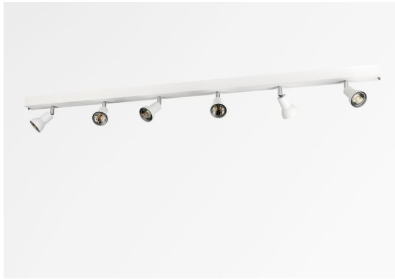
CALLISTO 6 in Weiß strukturiert. Metalloberfläche Code: 01