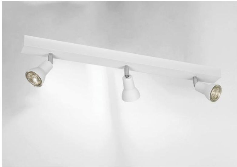
CALLISTO 3 in Weiß strukturiert. Metalloberfläche Code: 01