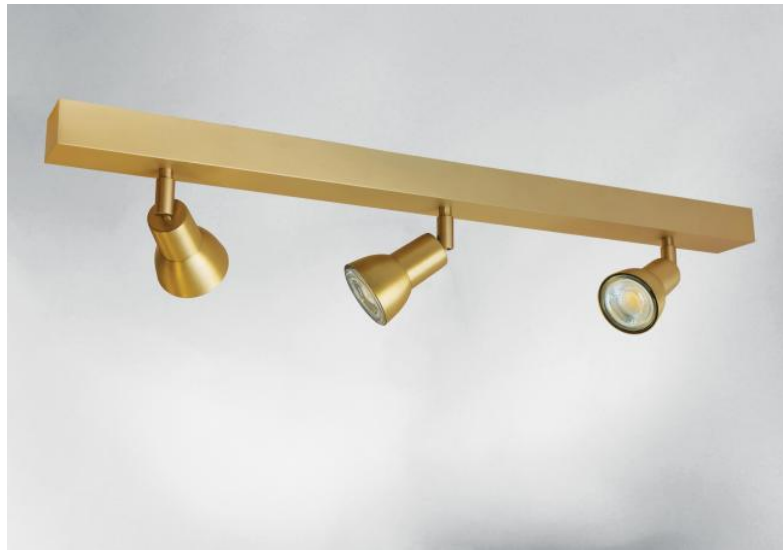
CALLISTO 3 in gebürstet Messing. Metalloberfläche Code: 25