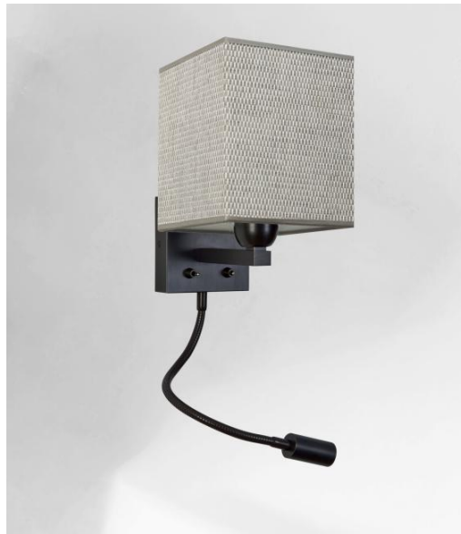
TEOS in gebürstet Bronze mit Lampenschirm in Parma Cendré (Stoffe aus Kategorie 4)