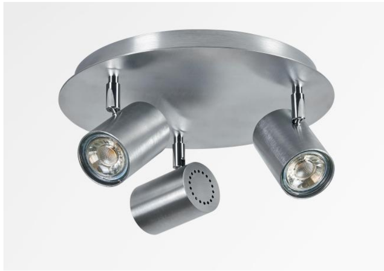
ATLAS 3 in gebürstet Chrom. Metalloberfläche Code: 32