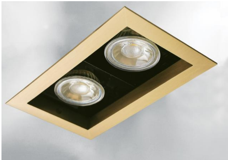
OURANOS 2 in gebürstet Messing. Metalloberfläche Code: 25. Innen in strukturiertem Schwarz