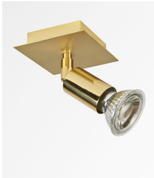
MERCURE 1 in Messing