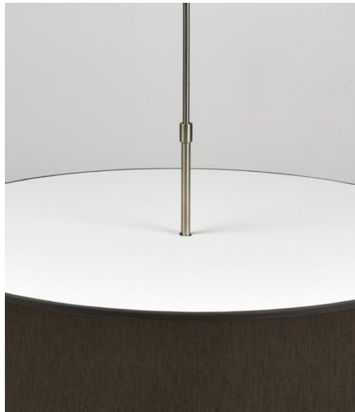
MOSKITONETZ gespannt und geklebt auf die Oberseite eines Lampenschirms KENTIKA 70