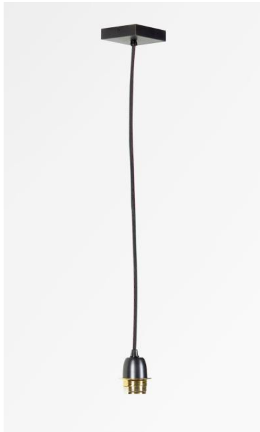
SUSPENSION # in gebürstet Bronze