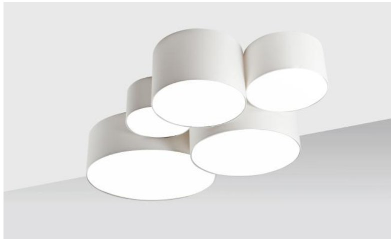
Lampenschirmen NAPATA in Coton calcaire ivoire (Stoffe aus Kategorie 1)