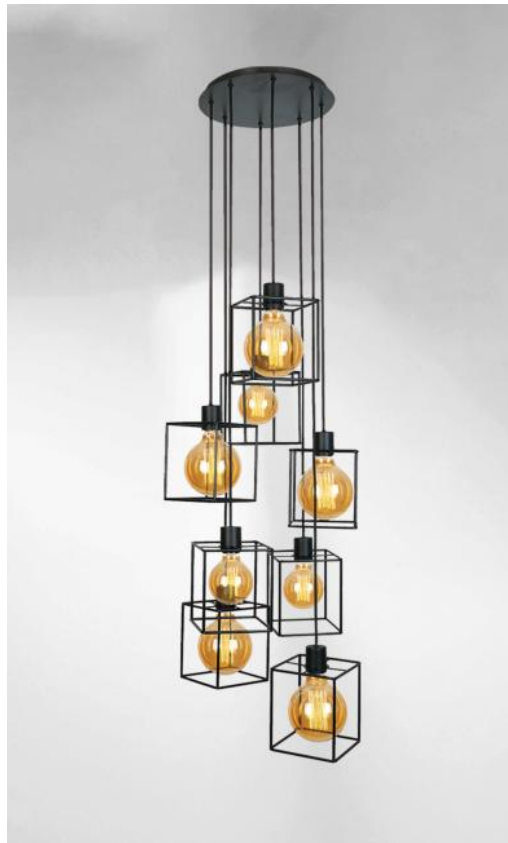
KERMA 8 o30 in gebürstet Bronze mit Strukturen in schwarzem Epoxy