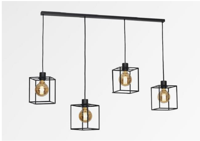
KERMA L 4 in gebürstet Bronze mit Strukturen in schwarzem Epoxy