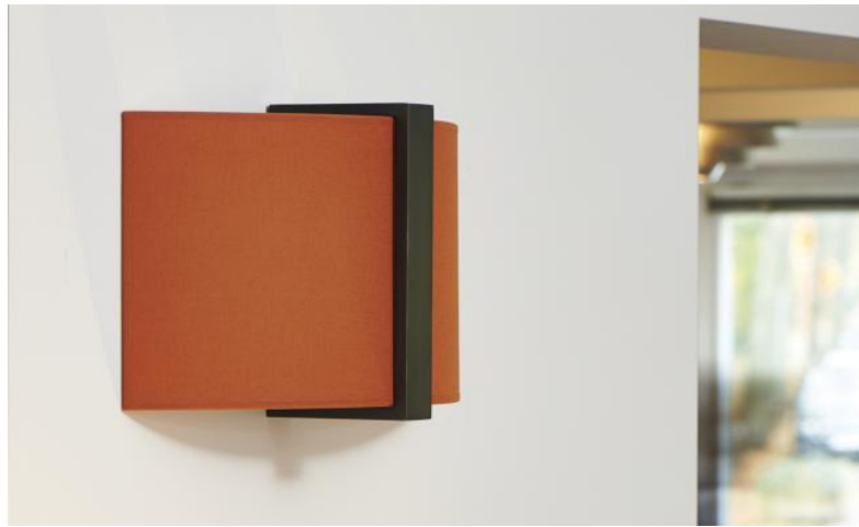
KAMOSIS in gebürstet Bronze mit Lampenschirm in Seta brique (Stoffe aus Kategorie 3)