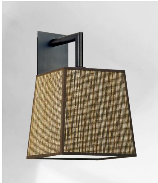
EDFOU 2 in gebürstet Bronze mit Lampenschirm Jacinthe Miel Noir (Material Kategorie 5)