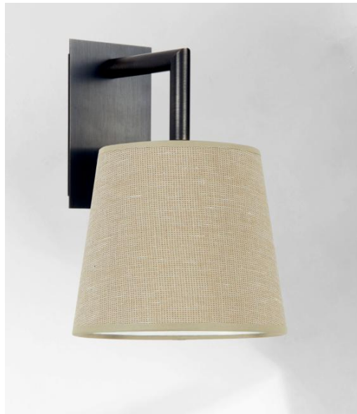
EDFOU 2 in gebürstet Bronze mit Lampenschirm in Stone Calcite (Stoffe aus Kategorie 4)