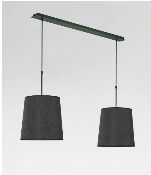
MEREROUKA 2 in gebürstet Bronze mit zwei runden Lampenschirmen in Stone Diorite (Stoffe aus Kategorie 4)