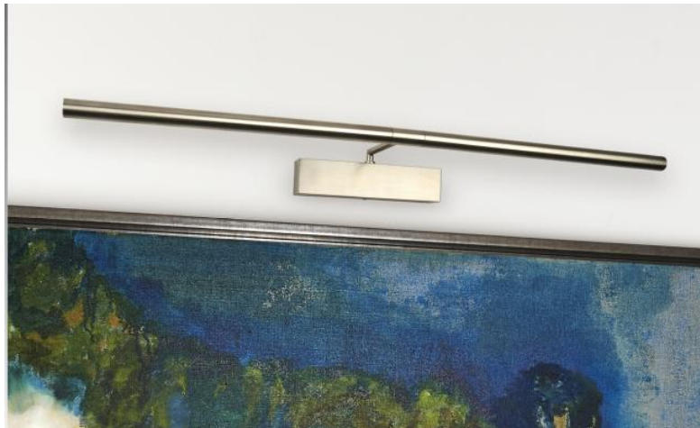
MEIDOU M 75 in gebürstet Nickel. Metalloberfläche Code: 33