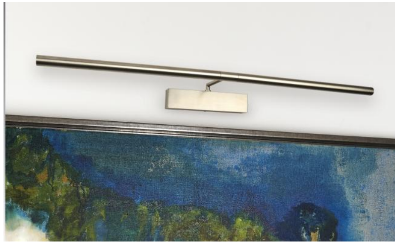
MEIDOU M 75 in gebürstet Nickel. Metalloberfläche Code: 33