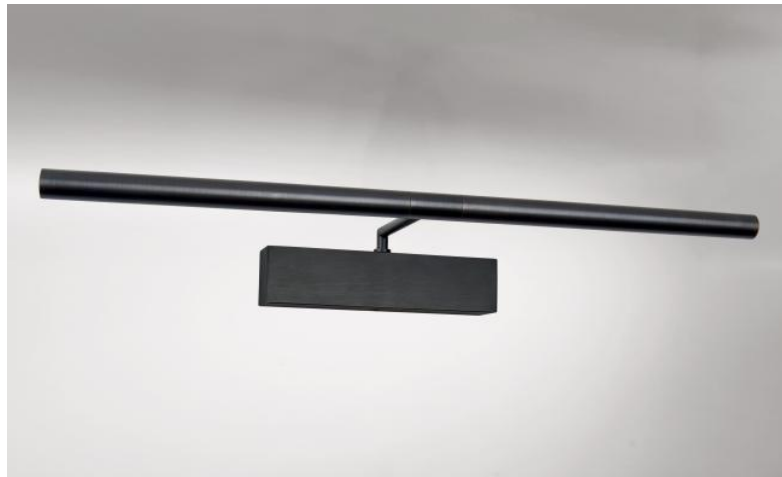
MEIDOU M 55 in gebürstet Bronze. Metalloberfläche Code: 29