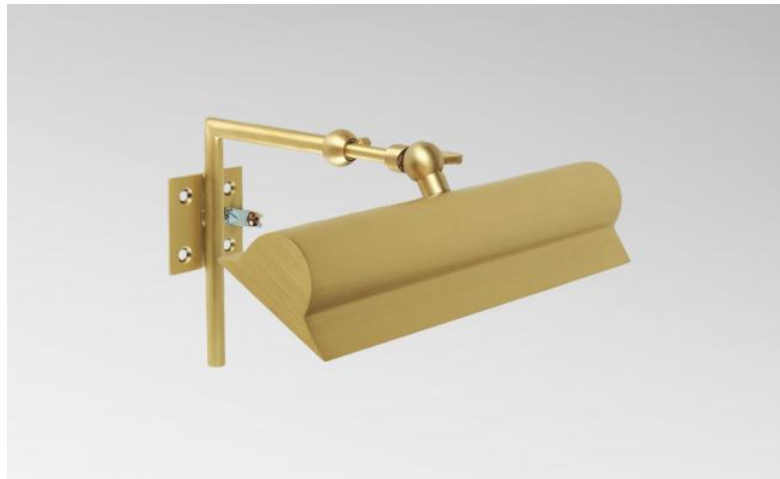
ET 22 in gebürstet Messing