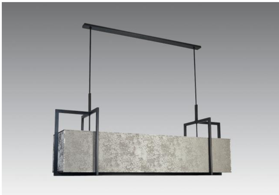
METELIS in geborsteld brons met lampenkap in gabala platinumium