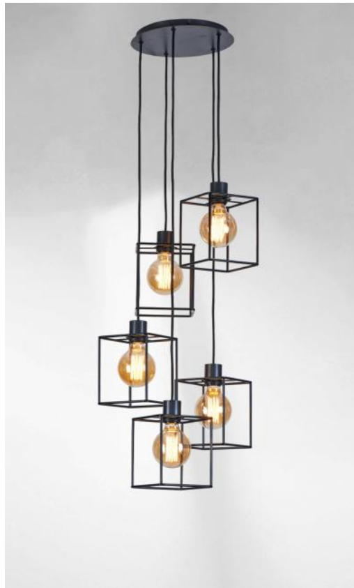
KERMA 5 o26 in geborsteld brons met structuren in zwarte epoxy afwerking