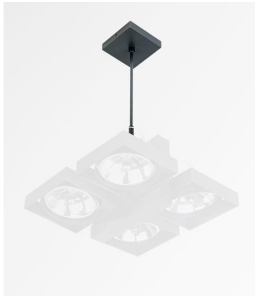
SARGAS 4 en bronze griffé monté sur une SARGAS 4 SUSPENSION