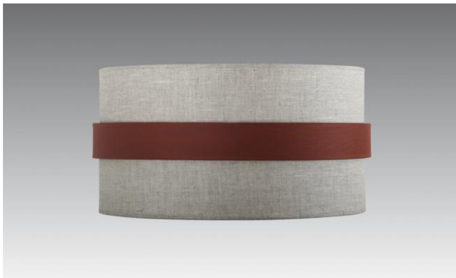
Abat-jour TOUYA 40 en lin moscou avec anneau en seta brun rouge