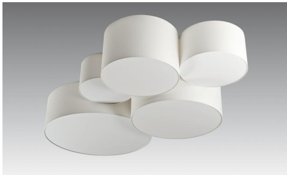
Lampenschirmen NAPATA in chinette ivoire